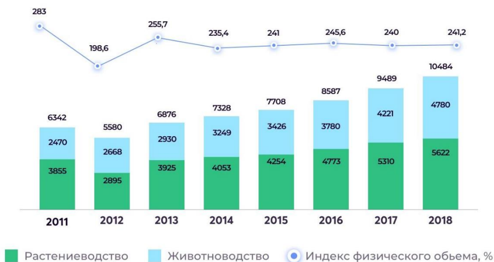
Диаграмма 1. Динамика производства в сельском хозяйстве в (млн. $)

По оценкам специалистов, сельскохозяйственная отрасль Казахстана обладает высоким экспортным потенциалом, на что указывают следующие преимущества: